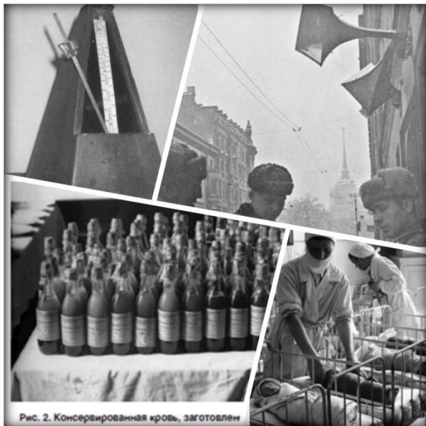
Рис. 2. Консервированная кровь, заготовлен

Для оповещения граждан о вражеских авианалетах на улицах