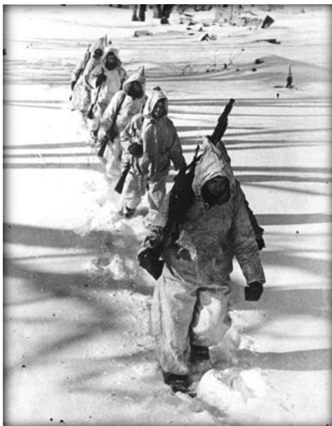
Солдаты «Голубой дивизии», укомплектованной испанскими добровольцами, в районе посёлка Красный Бор под Ленинградом

В блокаде Ленинграда официально принимали участие немецкие, итальянские и финские войска. Однако при этом была ещё одна группировка, известная как «Голубая дивизия». Как известно, Испания не объявляла